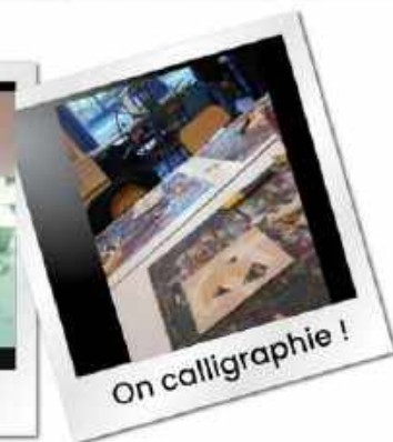
On calligraphie !